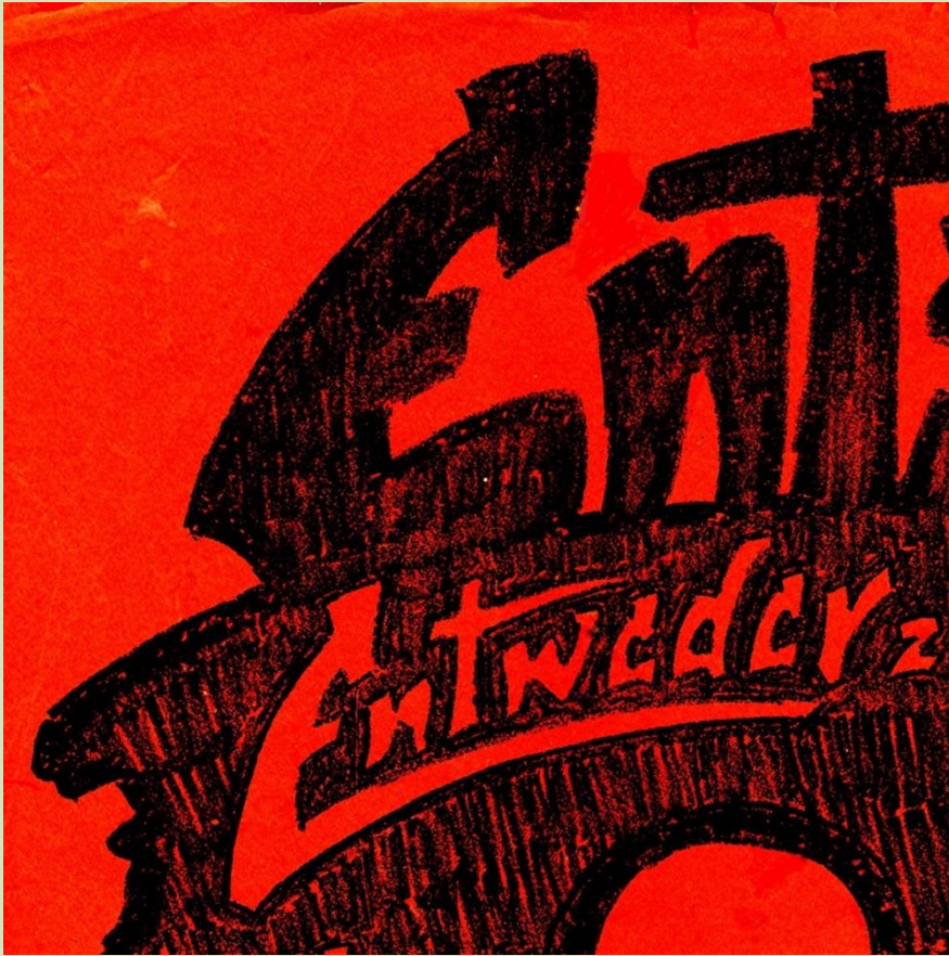
Aus dem ‚Wortfeuerzeug‘ von 1930